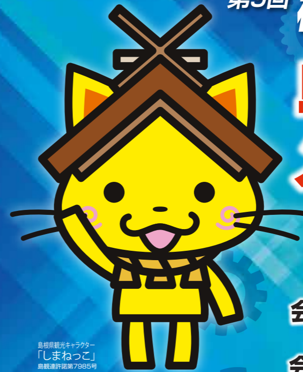
島根県観光キャラクター 「しまねっこ」 鳥取県産第7985号